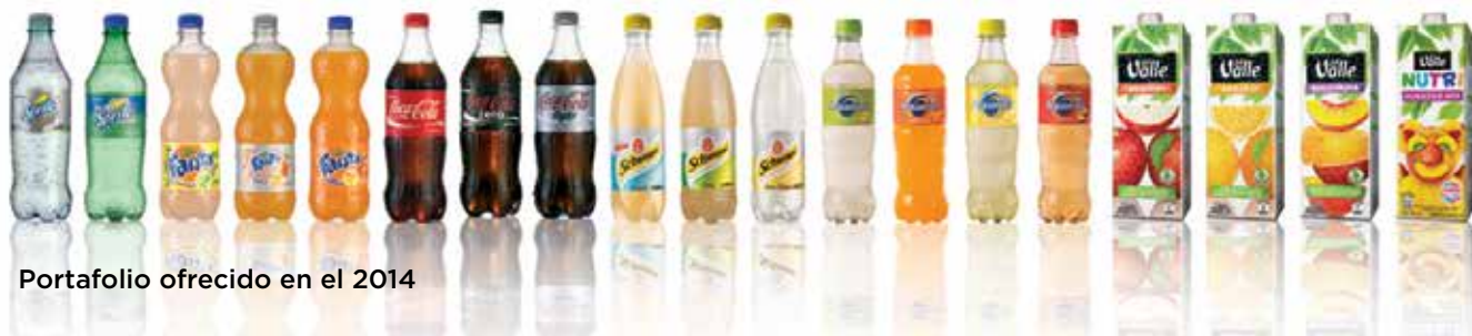
Portafolio ofrecido en el 2014